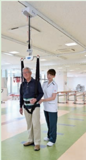
※掲載されている写真はイメージです。