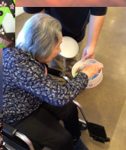
お参りの後は御守りを選んで・・・