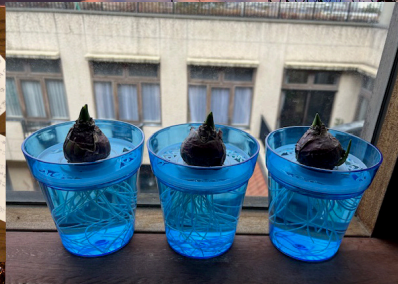
入居者様が育てているヒヤシンス