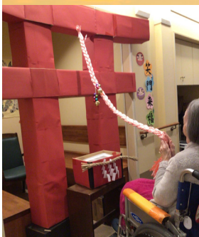
施設の神社で初詣